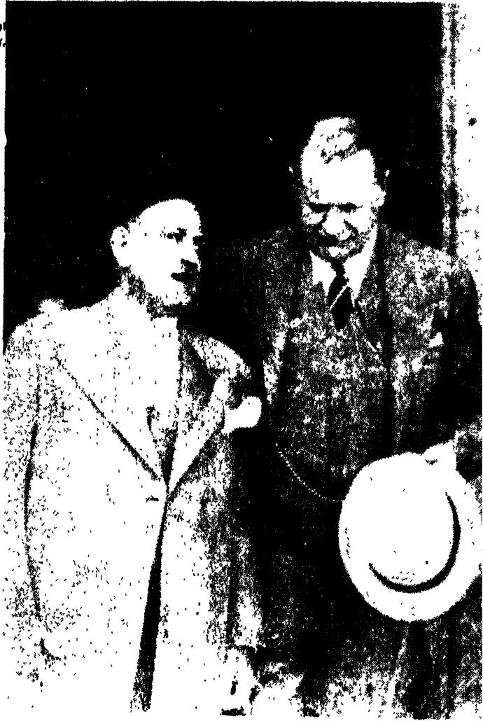
النحاس باشا والسفير البريطاني